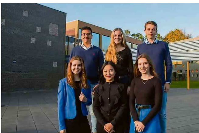
De crew van Asmun.

Zij zullen met behulp van 'confidentials' (zogenaamd vertrouwelijke informatie over het standpunt van de staat betreffende het onderwerp) de standpunten van de aan hen aangewezen staat verdedigen tijdens de mini-MUN. Zo leren zij de ROP goed toe te passen en kunnen ze met hun vragen nog bij ons terecht, terwijl wij het debat leiden en hen tips geven. Wij hebben nu twee trainingsdagen achter de rug en kijken ontzettend uit naar de derde en tevens laatste trainingsdag voor de conferentie.